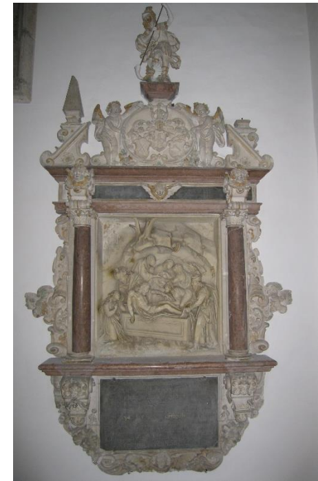
Epitaph des Georg Rothamer in der Bernauerkapelle in Straubing